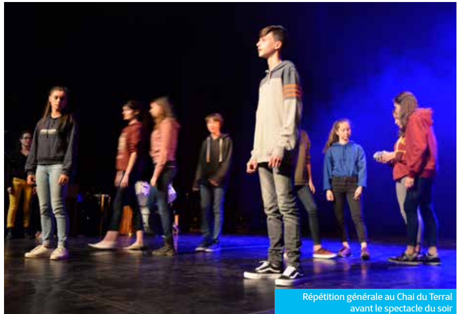
Répétition générale au Chai du Terral avant le spectacle du soir

Dans les discussions et les souvenirs de ces quatre années d'expérience, les collégiens font preuve d'une maturité