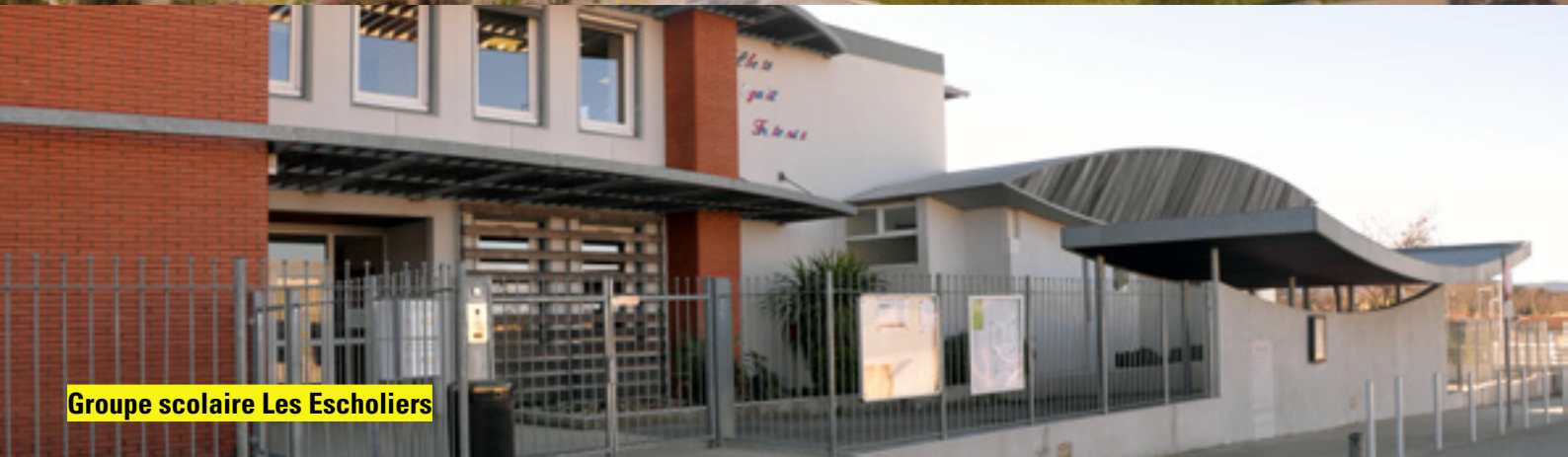
Groupe scolaire Les Escholiers