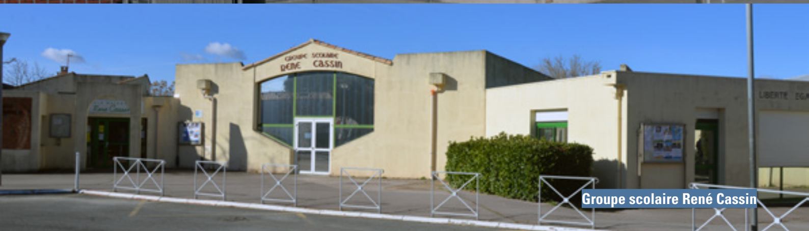
Groupe scolaire René Cassin