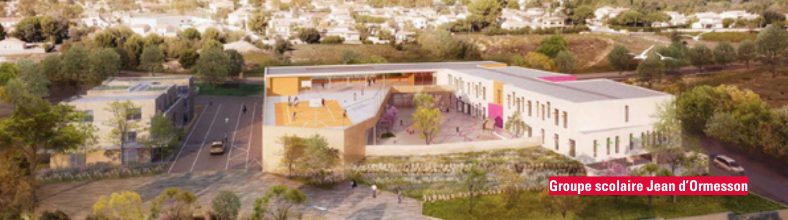
Groupe scolaire Jean d'Ormesson