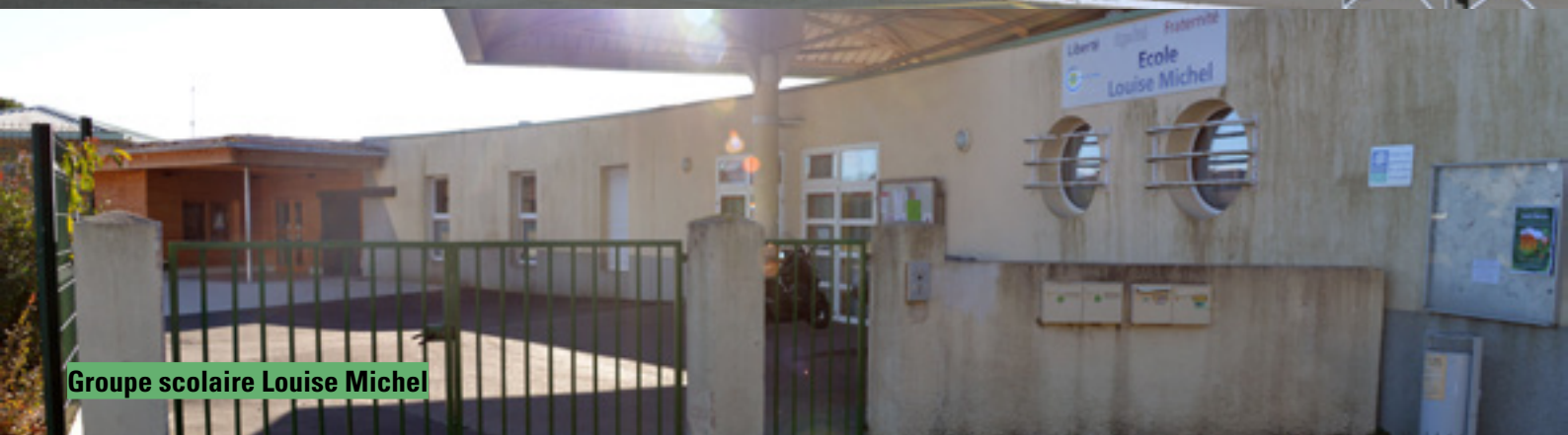
Groupe scolaire Louise Michel