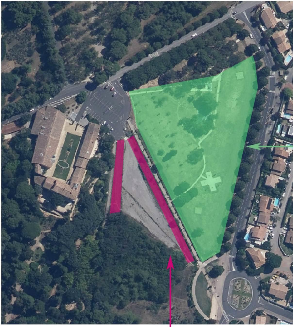
Secteur planté dans le cadre des appels à projet 8000 arbres 2019, 2020 et 2021 pour ombrager les accès et les zones de loisirs

Un goutte à goutte sera créé pour garantir la bonne reprise des végétaux.