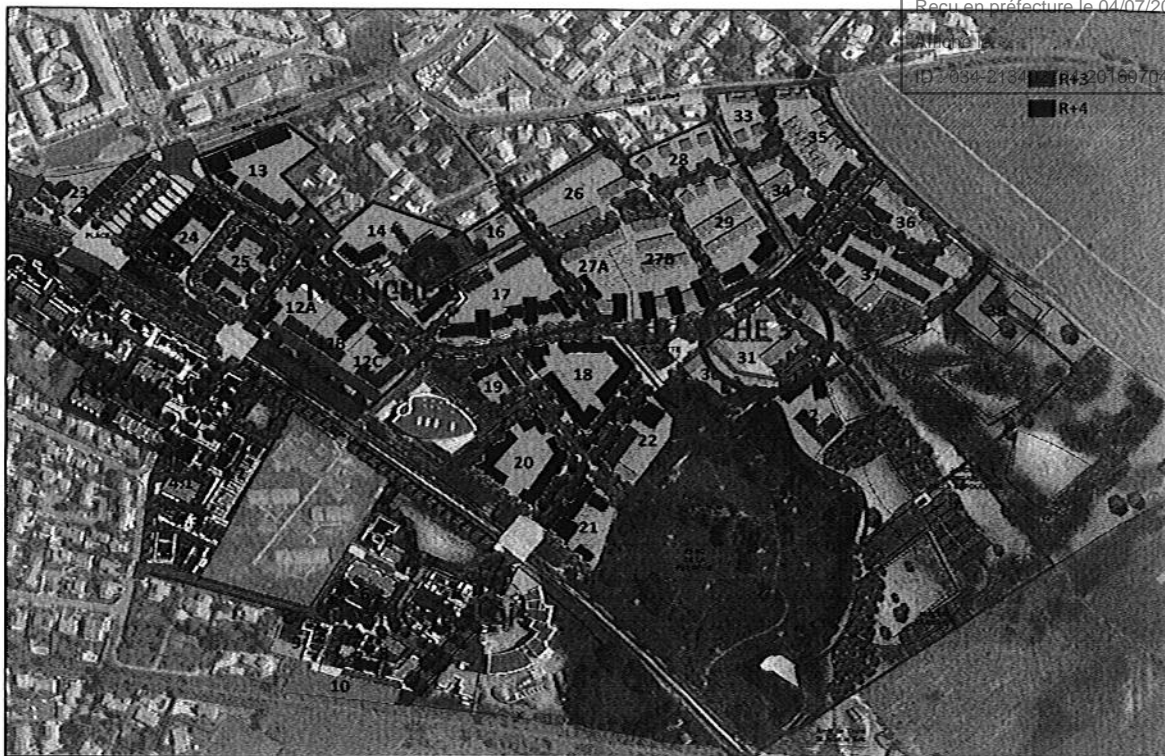
Localisation du futur groupe scolaire (lot 31)